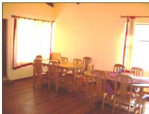
Dormitorios y comedor del Albergue Comunitario de Lagunillas