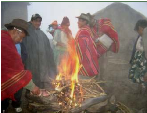
Rituales para la prosperidad

La farmacopea está hecha en base a hojas, raíces, flores, semillas, resinas, hueso, madera y metal, grasas, polvo de