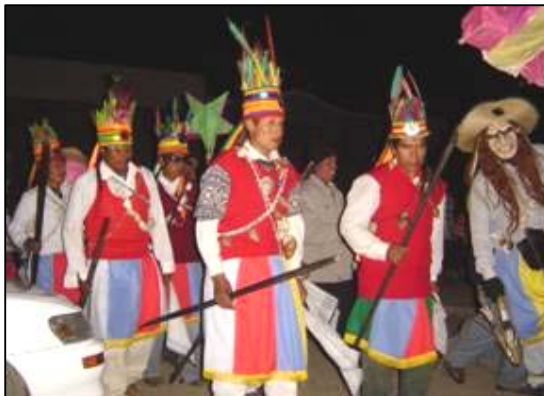
Danza de los Chunchus en la fiesta patronal de Curva

con hábitos o patrones migratorios temporales transitando periódicamente y ofreciendo sus servicios por zonas alejadas. Los primeros indicios encontrados sobre el origen de la población de las zonas altas y valles muestran a éstos como descendientes del imperio Tiwanakota en el periodo expansivo y según estudios de Carlos Ponce Sanjines, se relacionan con la cultura Mollo.