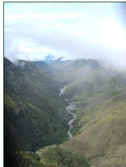
Cordillera de Apolobamba fuente de Agua