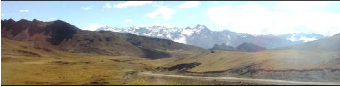
Cordillera de Apolobamba