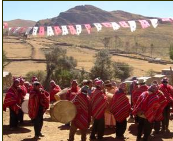
Fiesta en la comunidad de Lagunillas