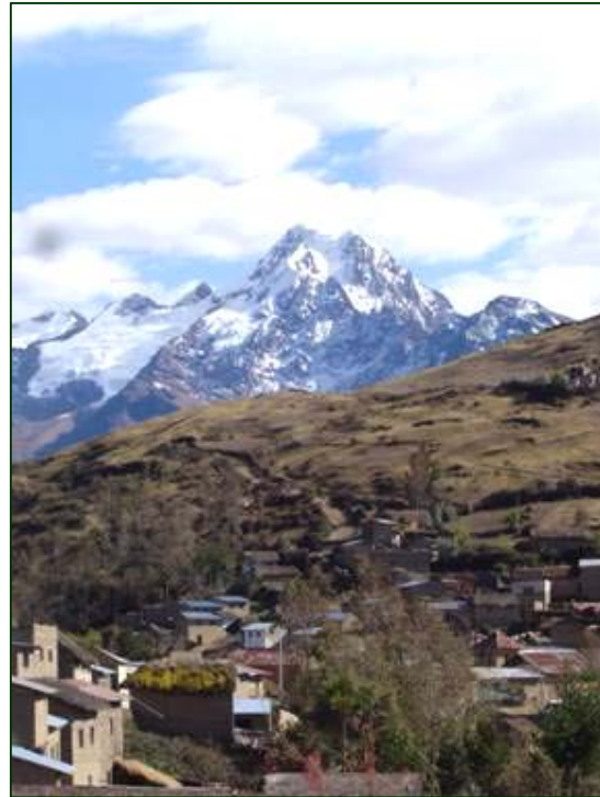
Pueblo de Curva a los pies del nevado Akamani

El origen de estos expertos en plantas y amuletos es todo un misterio. El Término Kallawayá, tiene diferentes acepciones, por ejemplo, proviene del aymará Qolla, que quiere decir medicina; del quechua Kallawayá, que quiere decir, el que lleva medicina en hombros y también del idioma puquina Kalli'wayai que significaría aspirante a sacerdote o iniciado. Lo más probable es que la denominación Kallawayá provenga de los aymaras y quechuas que observan a los habitantes de una región determinada,