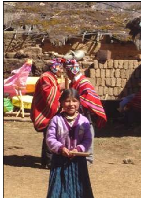
Músicos de la comunidad de Lagunillas

La ubicación geográfica fue un enlace fundamental entre conocimientos andinos y amazónicos, del mismo modo, la región es una fuente importante de agua, diversidad biológica y conocimientos tradicionales, pero también, paradójicamente, tiene una acentuada pobreza 9 (95%) y aislamiento frente al resto del país.