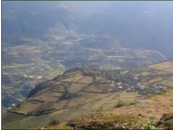
Pueblos ubicados entre quebradas de valle

Testimonios de los siglos XVI y XVII se refieren a la minería de la región, Garcilazo de la Vega decía que “Las minas mas ricas están en el Oriente del Cuzco”, en la Provincia llamada Kallawaya, que los españoles llamaron “Carabaya”.