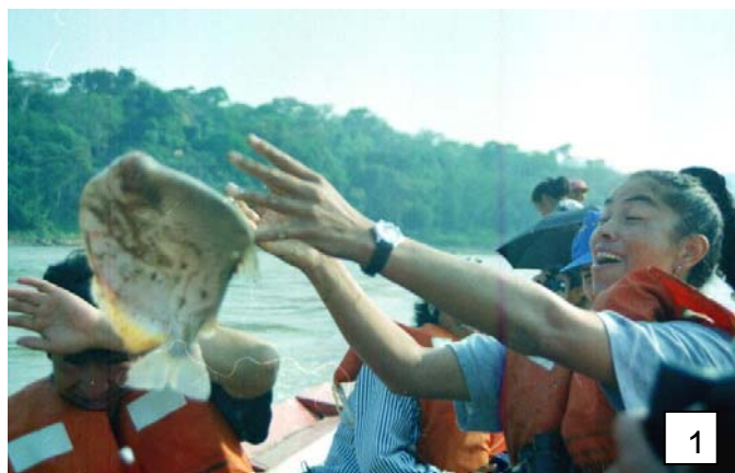
Atrapando el pez en el Tuhichi,

Las Mancomunidades empiezan a tomar un rol protagónico en la promoción de la imagen del país. Estas asociaciones municipales han delineado sus objetivos en un marco de desarrollo en el que involucran a una de las actividades de mayor crecimiento económico mundial: El turismo. En esta oportunidad, mostramos de manera resumida, los objetivos y perspectivas de mancomunidades que tienen avances importantes en el tema turístico, aquellas que están atrapando el pez... y otras que lo atraparon y no lo dejarán escapar, sin embargo, las redes deben fortalecerse articulando políticas que consoliden estas asociaciones que son una base de la construcción y estructuración de territorios a partir de alianzas y visiones conjuntas.